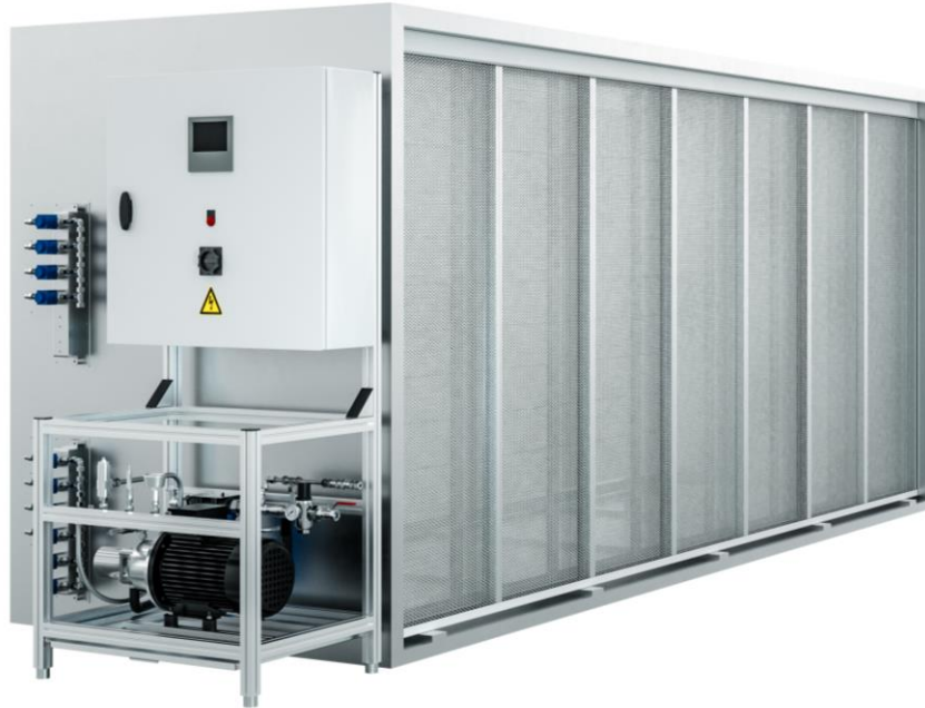
Abbildung 1: Beispielbild Jetvap mit Gehäuse